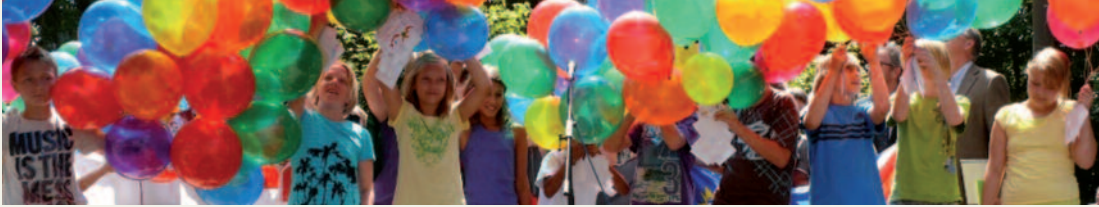
Das GAG feiert seine Aufnahme in das Netzwerk der UNESCO-Projektschulen.